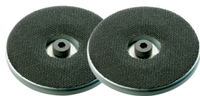
Juego de placas de soporte básico completo.