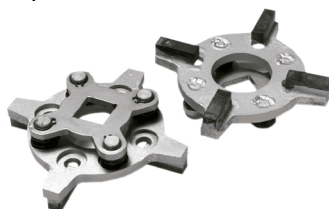
Juego de discos abrasivos de diamante.