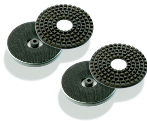
Juego de diamante para desbaste en húmedo.